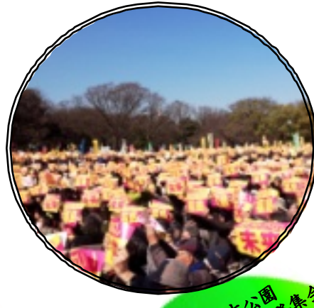
3月26日代々木公園 3・11 5周年脱原発集会。35,000人が参加。