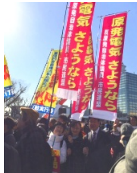
3月26日の脱原発集会・デモでお披露目、2000円で頒布