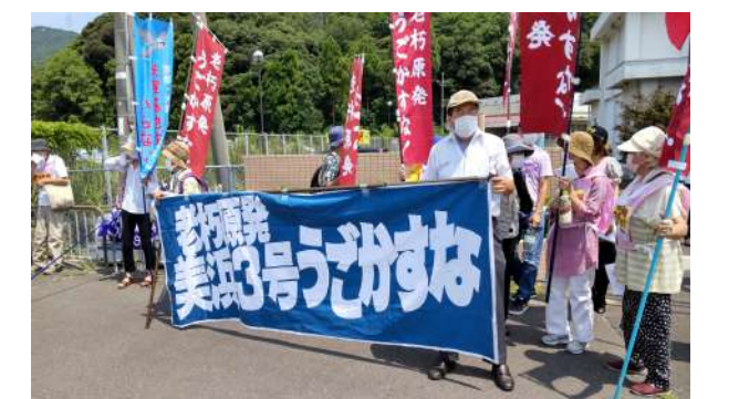
8月10日美浜3号機動かすな現地行動

一方岸田政権は、昨年10月の「エネルギー基本計画」で「原発の新設やリプレースは想定していない」としながら、1年も経たないうちに原発推進に政策転換しました。なお、大阪地裁に申し立てられた「美浜3号運転差