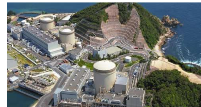
40年超えで再稼働した美浜原発3号機（手前）

若狭湾の美浜・高浜原発、東海第二原発等老朽原発の40年超え延長を許さず、80年超えへの法改定には、全国各地で大衆行動に取組み、署名運動や国会議員への働きかけを強めましょう。またこれを機会に、さらに全国的なネットワークをめざします。